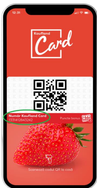
Figură 1. Unde se află numărul de Kaufland Card digital