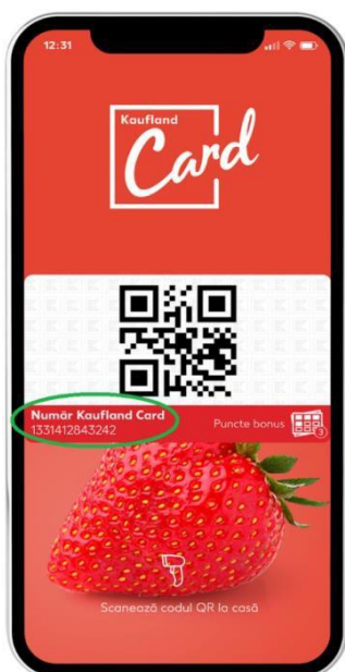
Figură 1. Unde se află numărul de Kaufland Card digital